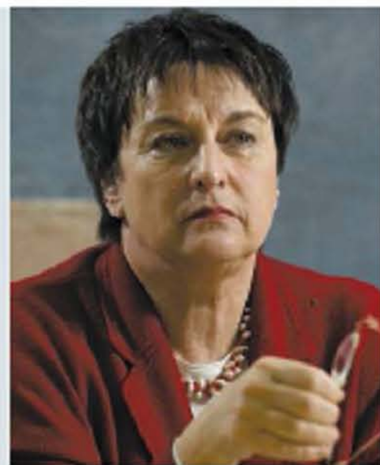
Justizministerium Brigitte Zypries (SPD)